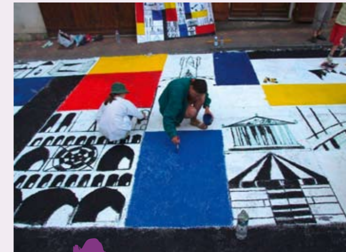
Les graffeurs en action au Touvet en 2009.

Le programme détaillé sera présenté dans le prochain Lumb'info.