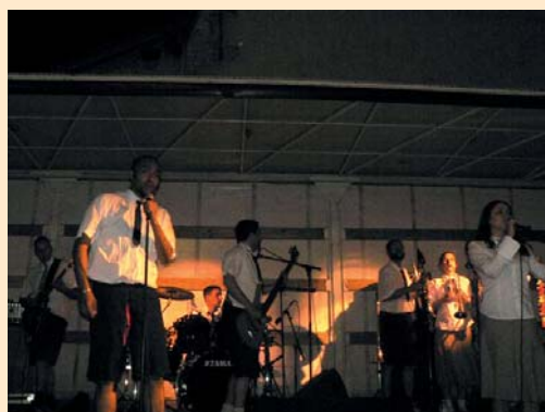
les Fils De William

Après avoir joué sous le nom de «5 sur 5» pendant quelques années (Grésiblués 2007 à la Terrasse), c'est avec de nouveaux membres en section de cuivres, avec un nouveau répertoire Funk'n soul et sous un nouveau nom : les FUNKSTERS, que cette formation revient, avec comme seul objectif, celui de vous faire partager le plaisir qu'ils prennent sur scène.